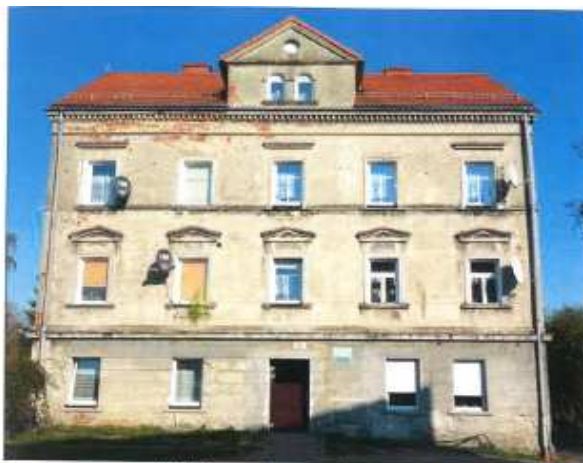
Widok elewacji frontowej – ul. Leśna nr 10.

na sprzedaż lokalu mieszkalnego Nr 7, znajdującego się w budynku położonym w Lubaniu przy ul. Leśnej 10 wraz z udziałem we współwłasności nieruchomości gruntowej (działka nr 52, AM 15, Obręb V o powierzchni 131,00 m 2 , JG1L/00026996/6).