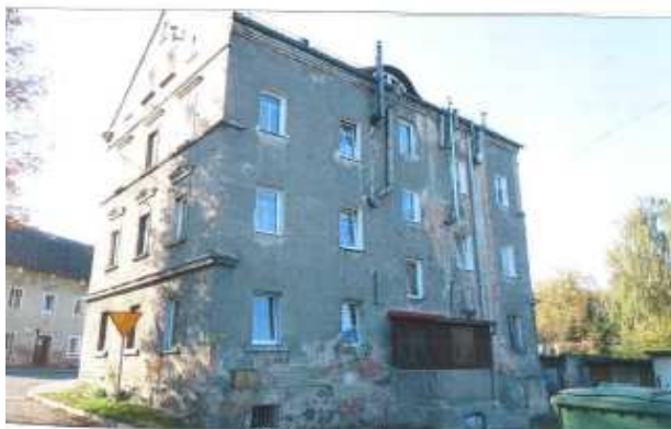
Widok z przeciwnej strony.